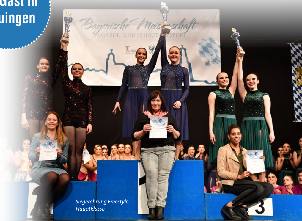
Siegerehrung Freestyle Hauptklasse