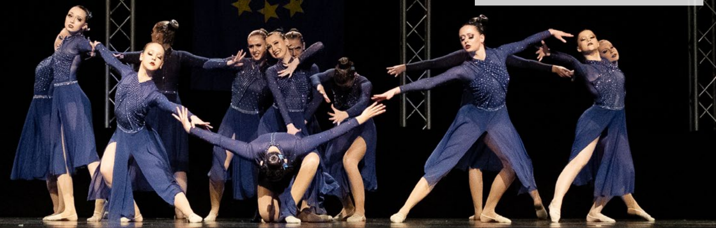
TSA d. TSV/DJK 1905 Wiesentheid e.V. - Magic Angels