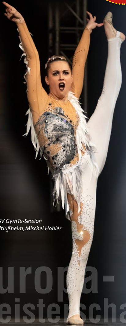
TSV GymTa-Session Altlußheim, Mischel Hohler

2019 ging der 1. Platz im Länderpokal an den Titelverteidiger Deutschland. Den 2. Platz erreichte Belgien, der 3. Platz ging nun bereits zum zweiten Mal in Folge nach Österreich. Der 4. Platz ging somit an die Niederlande. Die Sportwarte nahmen die entsprechenden Pokale für ihre Nation in Empfang.