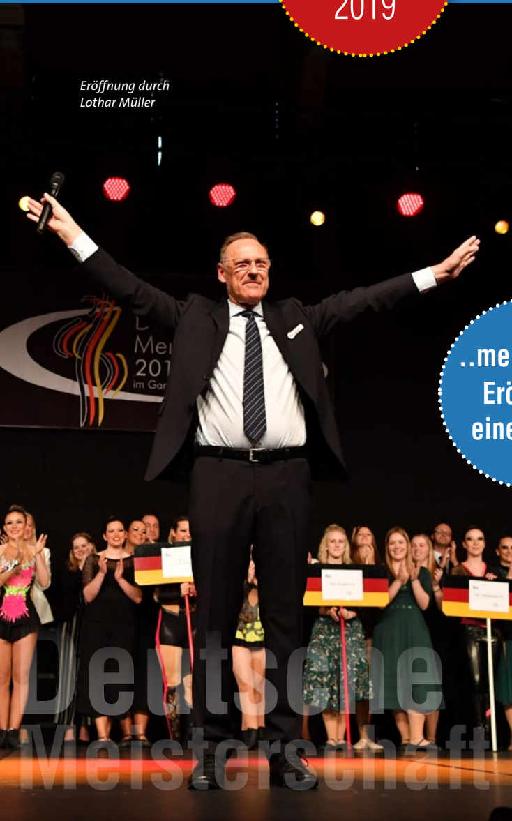
..meine letzte Eröffnung einer DM...