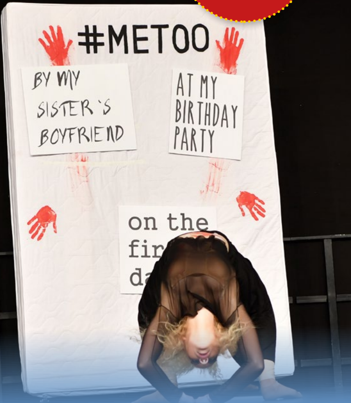
Schau Duo TSC Ottobrunn