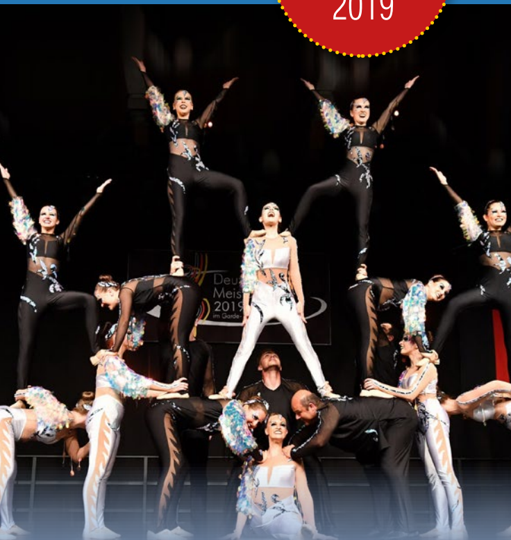
New Dimensions Velden

ernerster Natur. So vertanz ein Duo aus Altlußheim bravourös den Kampf um die Frauenwahlrechte im Jahr 1919. Eine andere Gruppe aus Bornheim regt mit der Geschichte um die Herstellung von Billigkleidung zum Nachdenken an, eine weitere aus Künzell vertanzt eindrucksvoll die autobiografische Geschichte der intersexuellen Künstlerin Lili Elbe. Weitere aktuelle Themen wie die #metoo Bewegung oder Klimaschutz werden beeindruckend auf die Bühne gebracht. Kurzum - packende Geschichten gepaart mit einfallsreichen Kulissen lassen nicht zu viel von diesen Meisterschaften erwarten. Die Show ist großartig - in jeder Altersklasse, in jeder Disziplin.