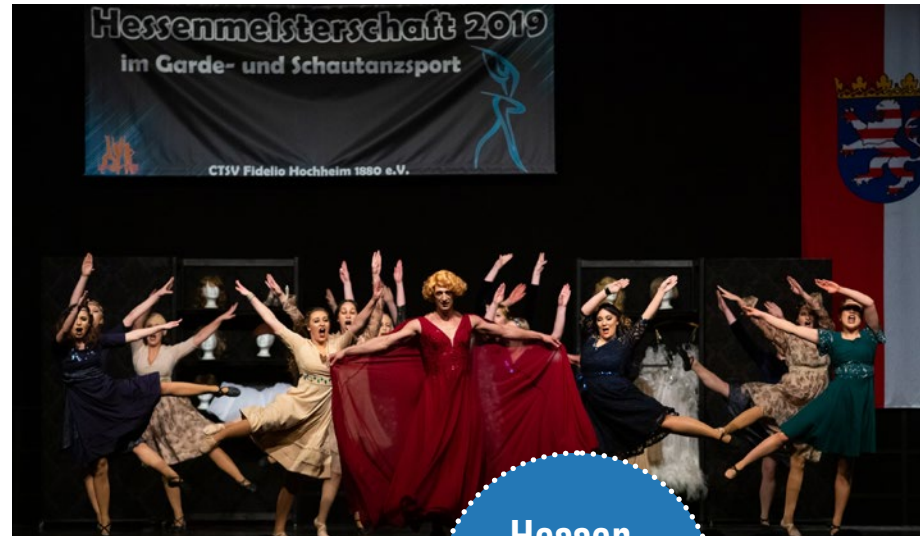
Schautanz Charakter - TSG Künzell