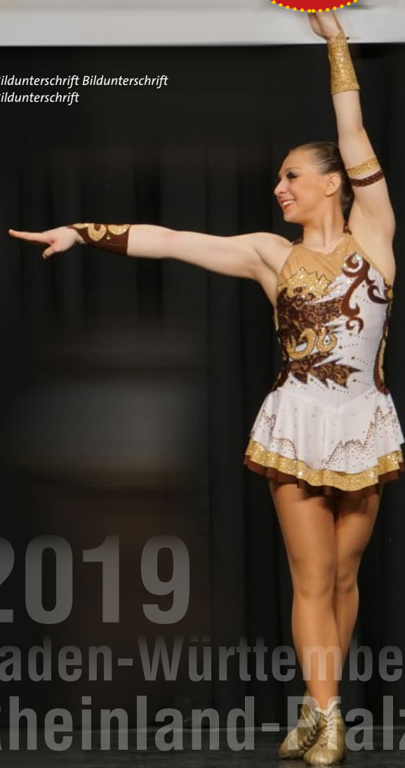
Bildunterschrift Bildunterschrift Bildunterschrift

Leistung, die vom Publikum mit viel Beifall honoriert wurde.