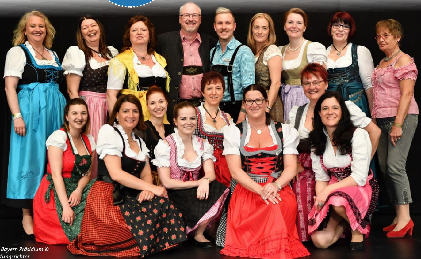
GSV Bayern Präsidium &amp; Wertungsrichter