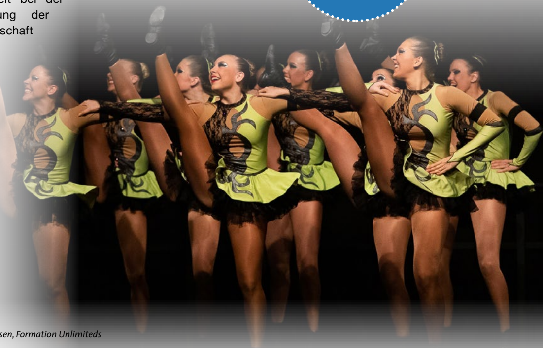
TV Hausen, Formation Unlimiteds