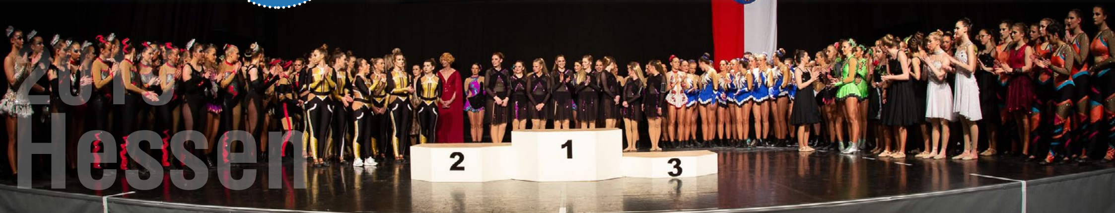
TSC 1996 Hofheim, Formation Tortugas