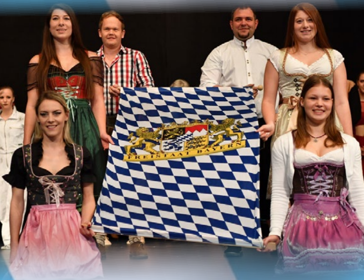
Einmarsch der Bayernfahne