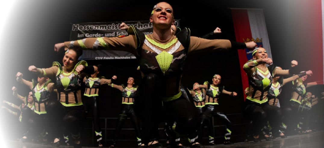
Modern - TSC Darmstadt 2000

Aktiven ein reichhaltiges Obstbuffet zur Verfügung, an dem sich nach Belieben bedient werden konnte. Diese Idee entstand in der Vorbereitungsphase der Meisterschaft während einer Präsidiumssitzung. Verschiedene Vorschläge wurden gegenübergestellt und diskutiert, am Ende machte das „Freiobst“ für die Sportler*innen das Rennen. Wir hoffen sehr, dass wir euch damit eine Freude machen konnten. Zusätzlich übernimmt der HVG in diesem Jahr bis zu drei Startgebühren für Gruppentänze. Jedem Verein wurden Gutscheine ausgehändigt, welche ▶