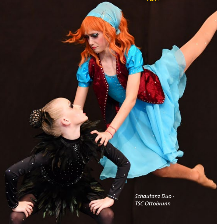
Schautanz Duo - TSC Ottobrunn