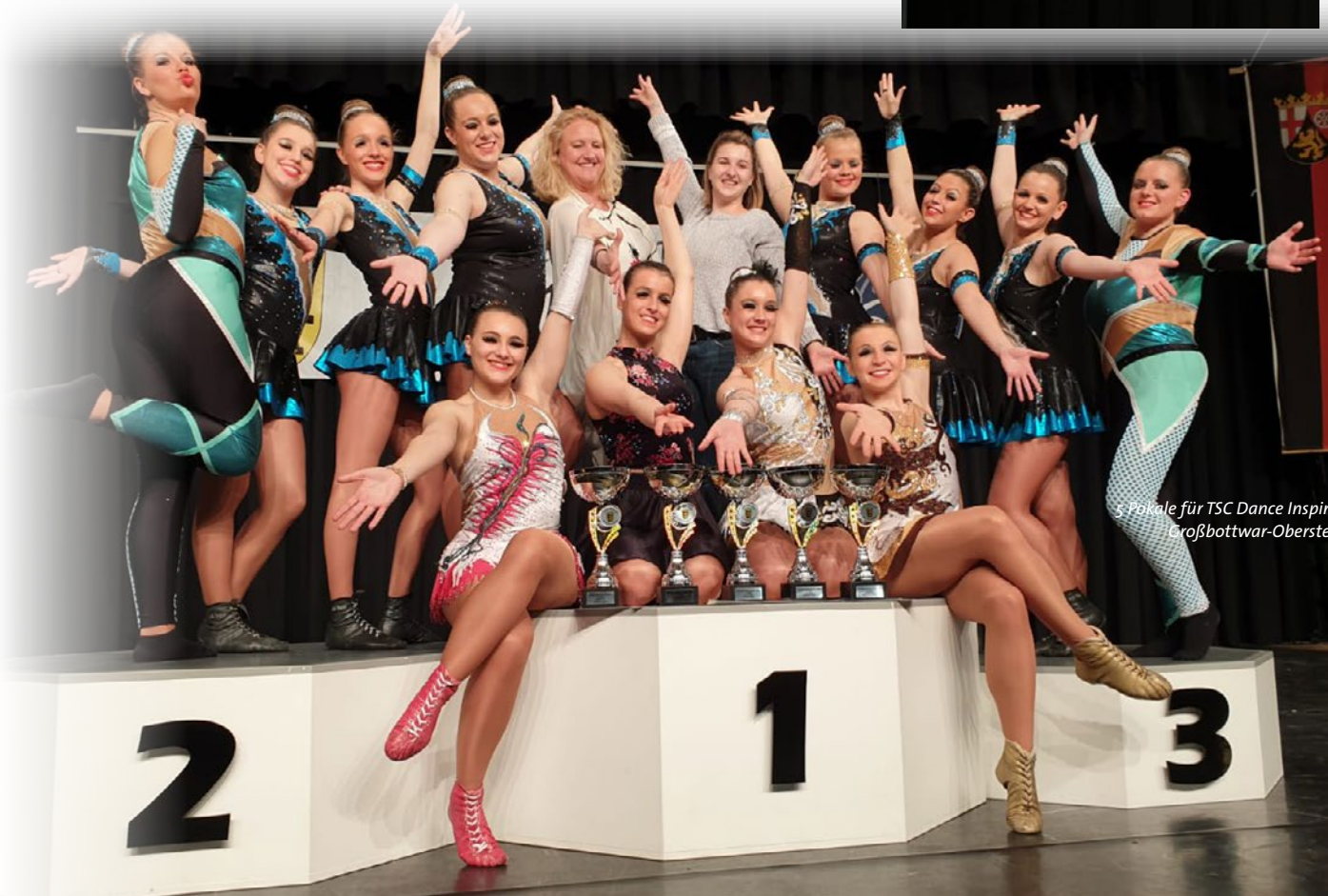
5 Pokale für TSC Dance Inspiration Großbottwar-Oberstenfeld